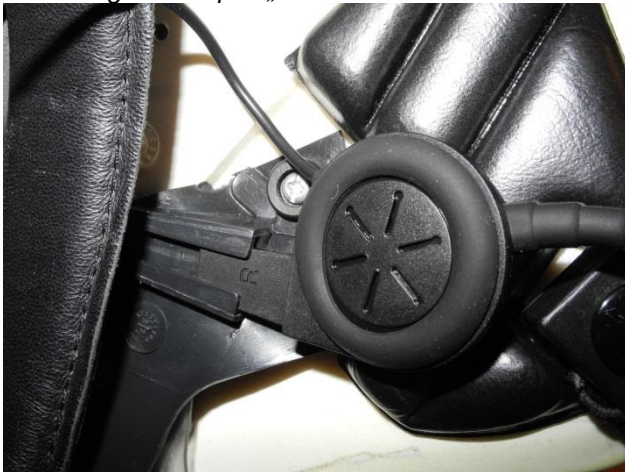
Abbildung 12 Beispiel „R“ rechts