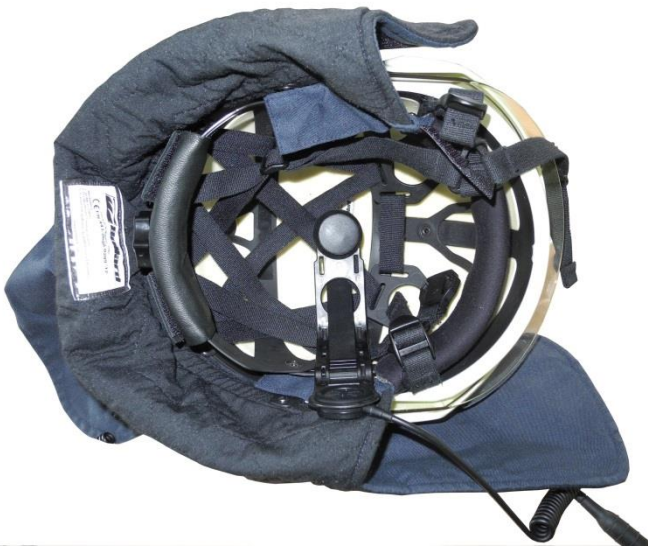
Abbildung 1 – Beispiel